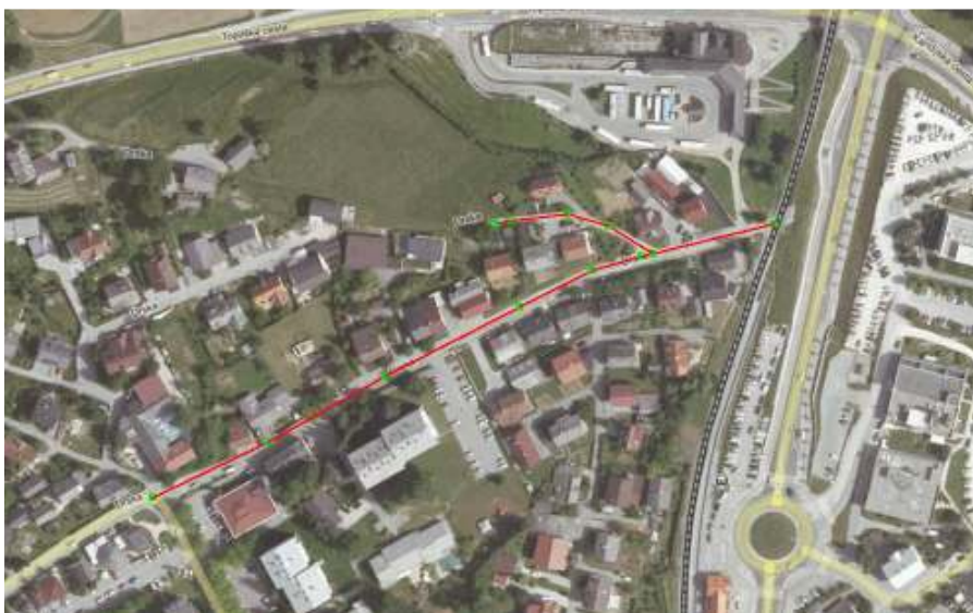
Slika 1: Prikaz obravnavane trase na DOF-u

Predmet obravnavane projekta za izvedbo (v nadaljnjem besedilu: PZI) je izdelava ureditve javne poti št. 799061 (v nadaljnjem besedilu: ulica) od križišča s Šegovo ulico LZ 299132 do železniške proge, v dolžini cca 320 m) v naselju Drska. Projektno je obdelan tudi priključek javne poti št. 799062 na obravnavano ulico. PZI zajema ureditev vozišča, peševih in kolesarskih površin, rekonstrukcijo vodovoda in kanalizacije za odvod odpadnih voda ter cestno razsvetljavo.