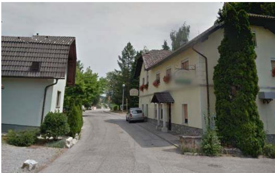
Slika 4: Pogled na »ozko grlo« pri gostilni Jakše