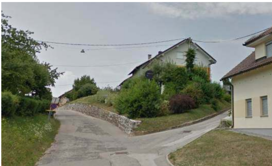
Slika 7: Pogled na strmi priključek javne poti št. 799062 na desni