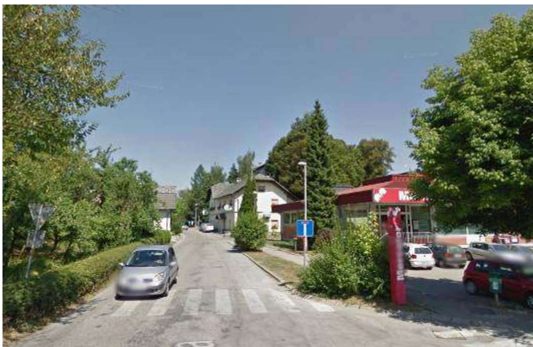
Slika 3: Pogled na začetek trase ulice s pločnikom ločenim z zelenico

Na koncu obravnavanega odseka se ulica slepo zaključi pred železniško progo Ljubljana – Novo mesto – Metlika, kjer je ograja.