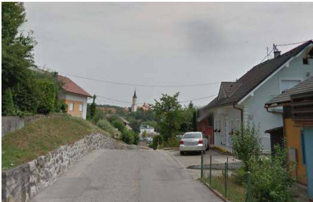
Slika 6: Pogled na ureditve ob vozišču v nadaljevanju, kjer ni obstoječega pločnika