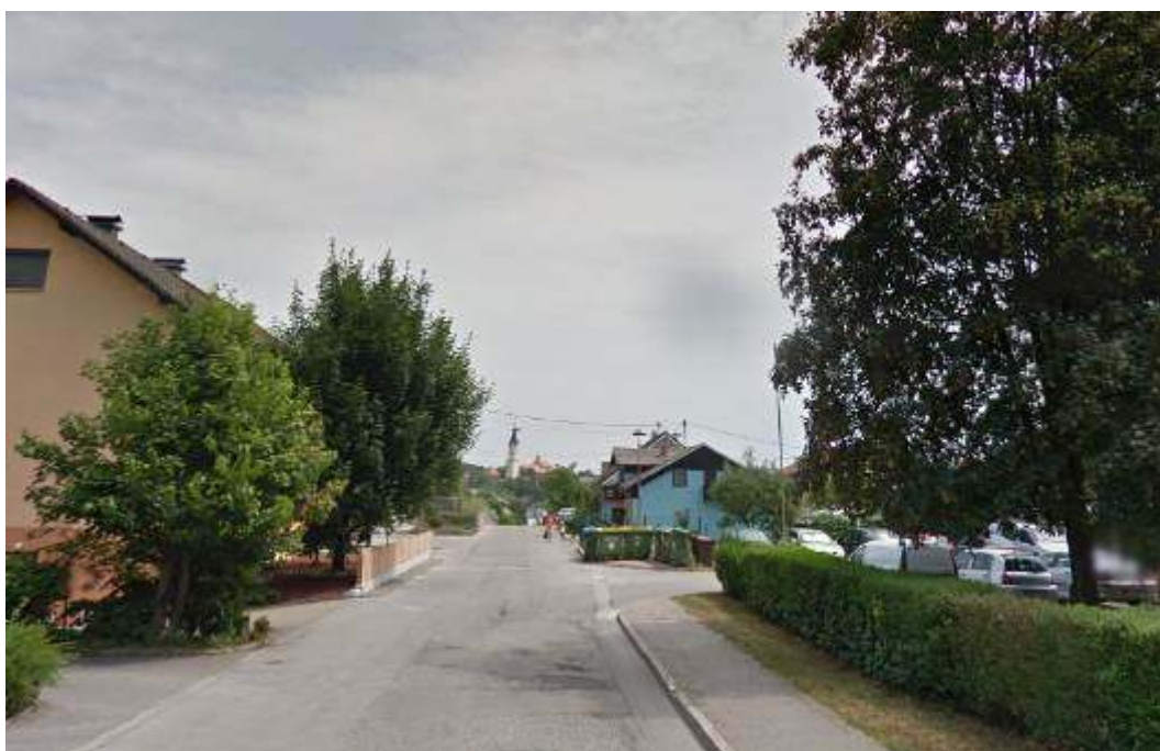
Slika 5: Pogled na konec pločnika