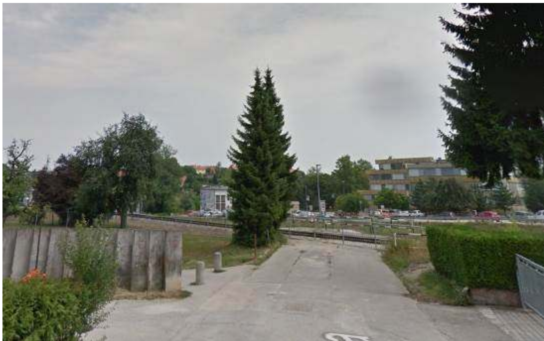
Slika 8: Pogled na zaključek ulice z ograjo pred železniško progo